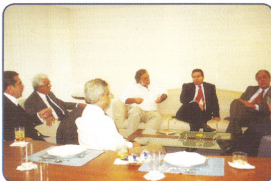
A diretoria do Sindicor-RJ e os ex-presidentes da BVRJ

Os ex-presidentes da Bolsa de Valores do Rio de Janeiro ainda em atuação no mercado reuniram-se com a diretoria do Sindicor-RJ, em 17 de fevereiro, para conversar sobre questões que afetam o setor e discutir estratégias de atuação conjunta.